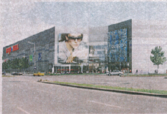
Im Stadtteil Liulin entsteht die neue Sofia Mega Mall

Das Marktforschungsunternehmen RegioPlan hatte sich zuletzt kritisch gezeigt, was den Ausbau von Shoppingcentern in Osteuropa und speziell in Bulgarien betrifft (Wirtschaftsblatt-Bericht vom 27.2.2009), da mehr Projekte geplant seien als die langsam wachsende Kaufkraft abdecken könne. Investoren würden oft zu wenig darauf ach-